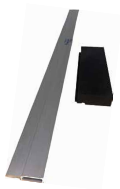
Nobbnr. 57171164 Monteringsverktøy

* Dette er viktig. Skjøtene skal ikke sparkles, men pusses lett * med et 240 sandpapir etter første malingsstrøk. Deretter males 1-2 strøk til. Pusser du for hardt eller med for grovt papir tar du bort strukturen i grunningspapeten.